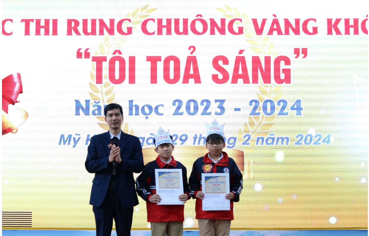
Á khoa của cuộc thi khối 6,7