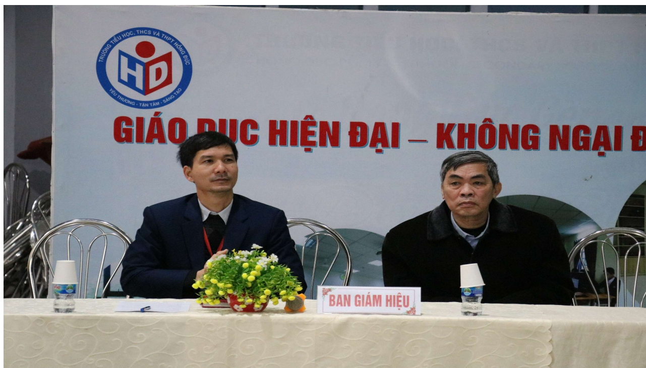
Ban giám hiệu nhà trường tham dự chương trình

Một số hình ảnh đẹp trong cuộc thi Rung chuông vàng: