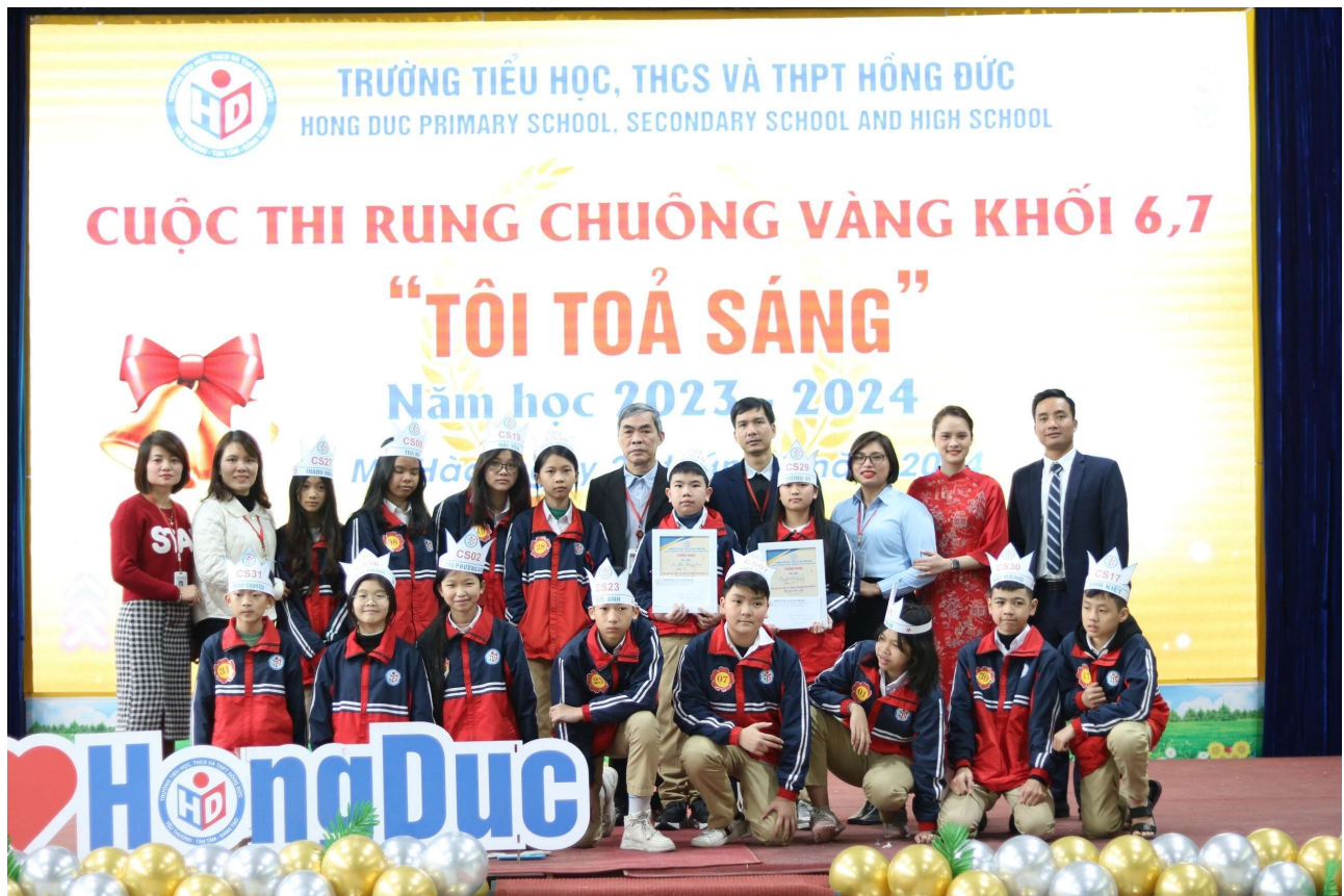
Ban tổ chức chụp ảnh cùng các thí sinh tham gia cuộc thi