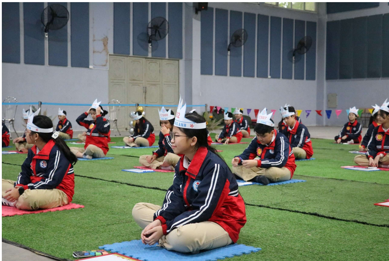
Các thí sinh chuẩn bị sẵn sàng trước khi bước vào vòng thi