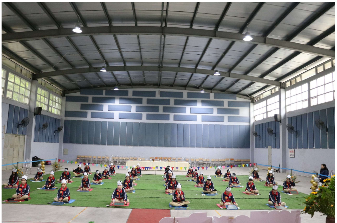
Các thí sinh trước khi bước vào vòng đấu