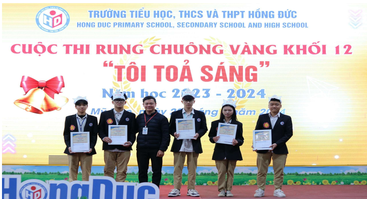
Các thí sinh đạt giải trong cuộc thi Rung chuông vàng khối 12

Cuộc thi Rung chuông vàng đã diễn ra thành công tốt đẹp. Ban tổ chức cũng xin gửi lời chúc mừng đến tất cả các em học sinh đã tham gia cuộc thi. Mong rằng các em tiếp tục cống hiến và phát triển trong hành trình học tập và thành công trong tương lai.