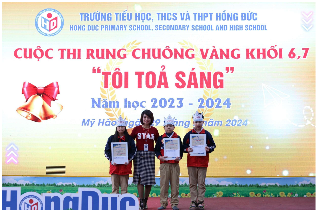
Các thí sinh đạt giải Ba