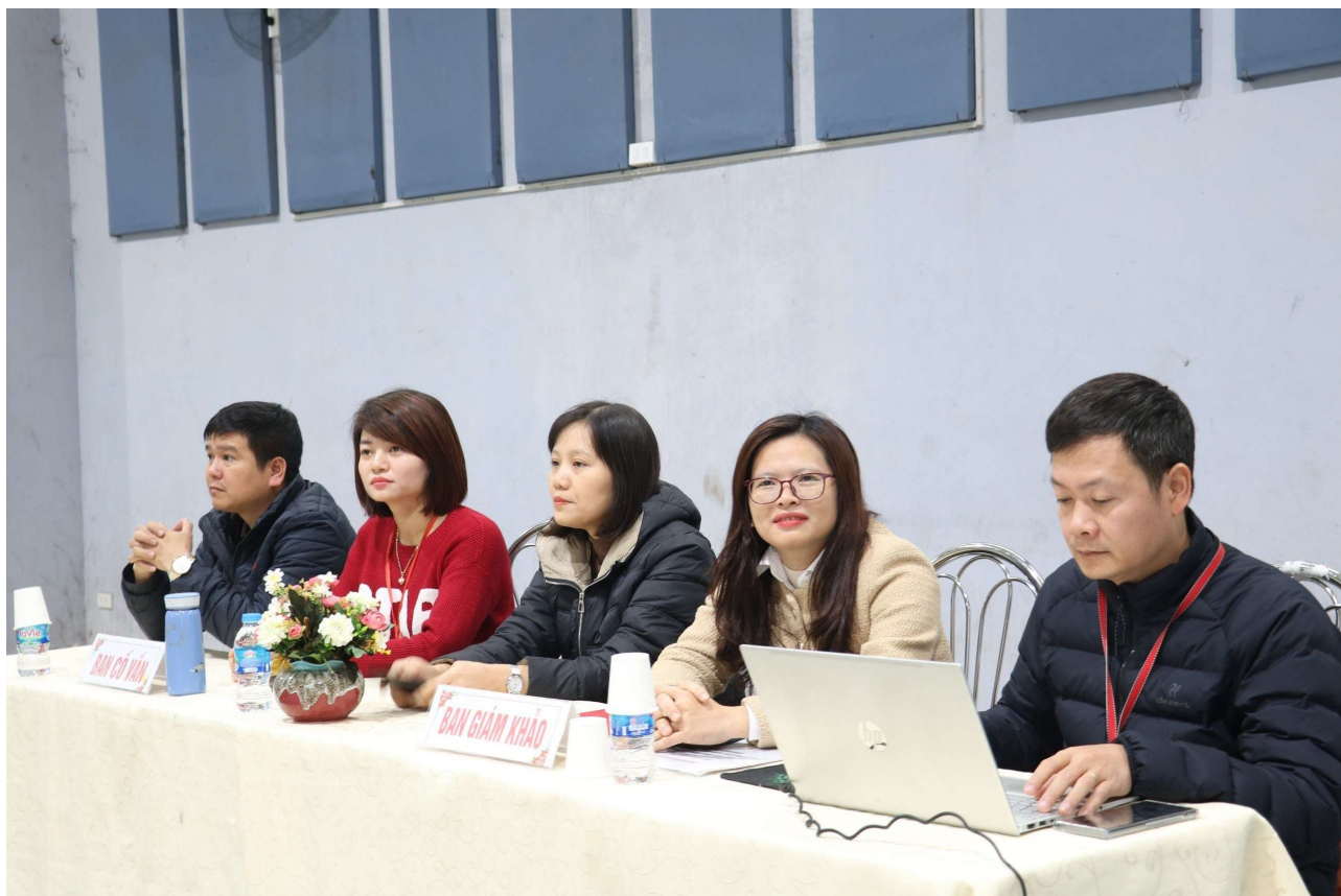
Ban giám khảo cuộc thi