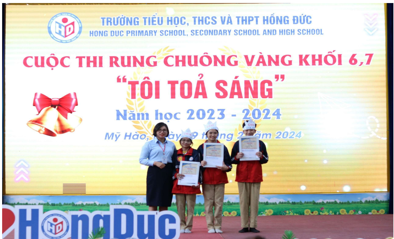
Thí sinh đạt giải Khuyến khích khối 6,7