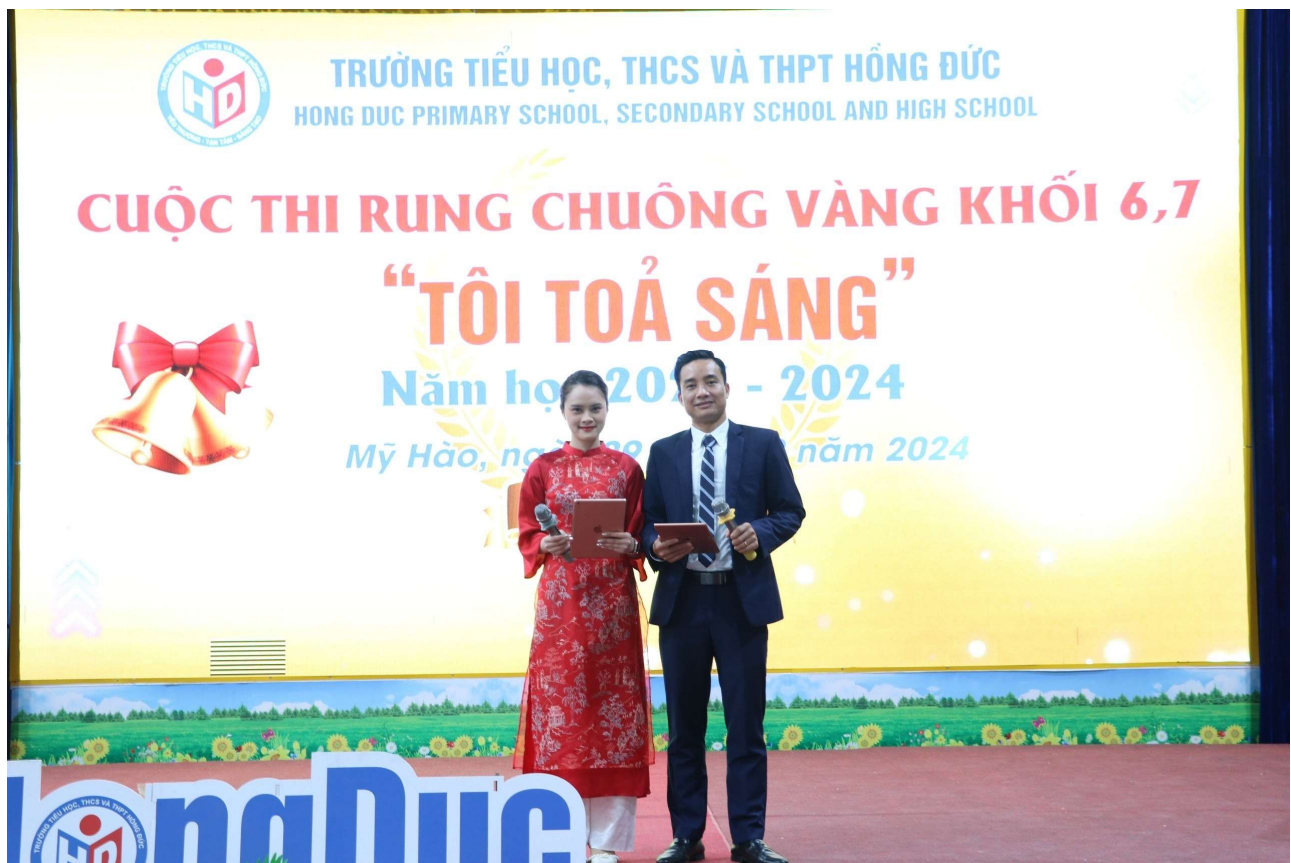
Hai MC tài năng của chương trình