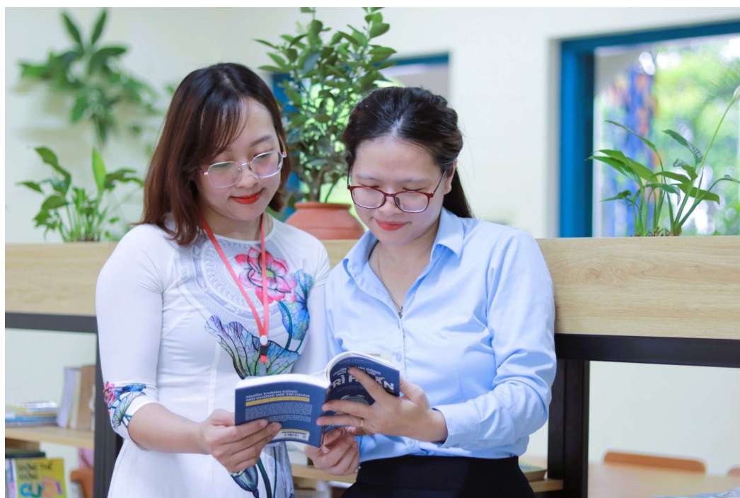
Giáo viên đọc sách tại thư viện mới

Ngày hội đọc sách và lễ ra mắt thư viện của trường đã thành công tốt đẹp. Sự thành công của "Lễ kỷ niệm Ngày sách Thế giới và ra mắt thư viện khối THCS và THPT" hôm nay là bước khởi đầu cho việc giáo viên, và học sinh tiếp tục niềm đam mê đọc sách để có những thông tin bổ ích.. lan rộng văn hóa đọc đến đông đảo học sinh trong toàn trường.