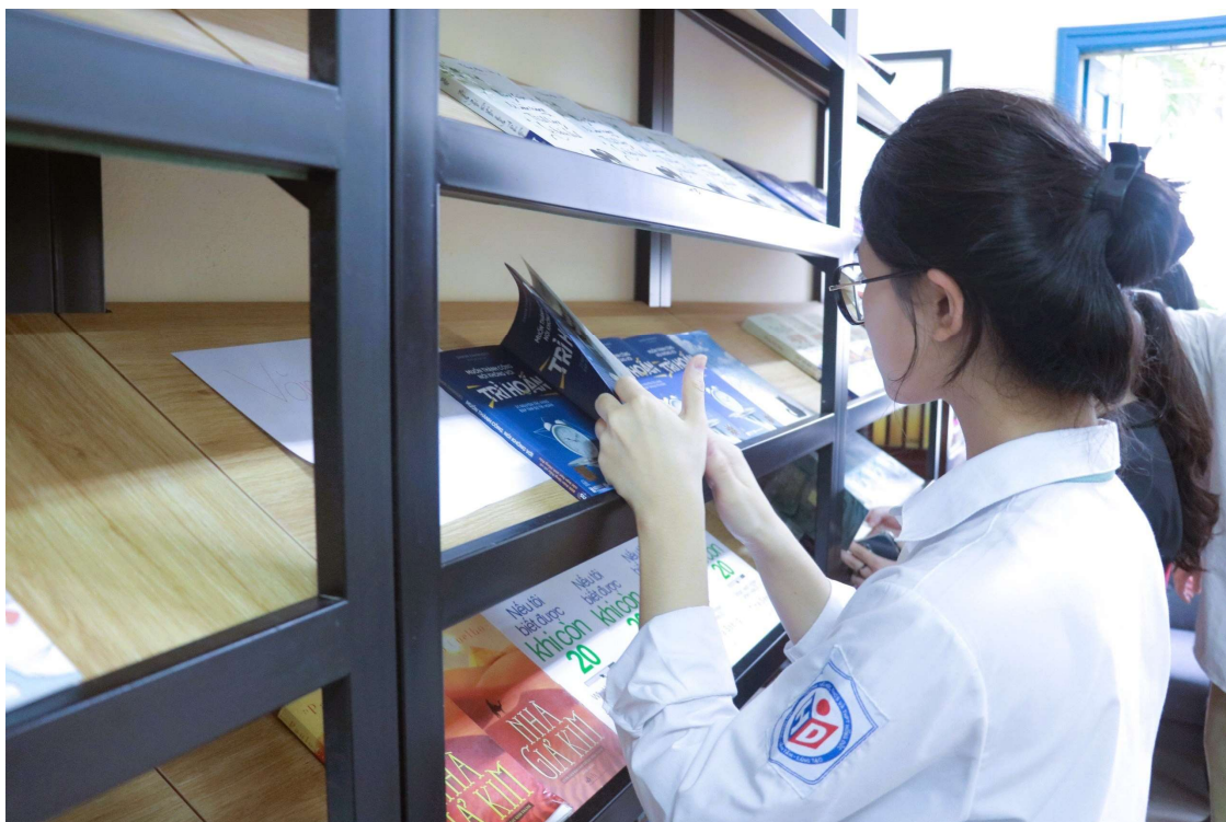
Học sinh tham quan thư viện mới