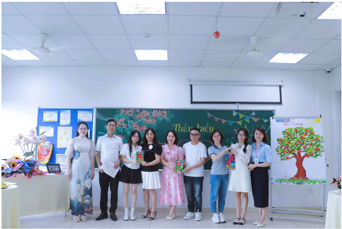
Ba mẹ tham gia khảo sát: Ba mẹ có thực sự hiểu con.