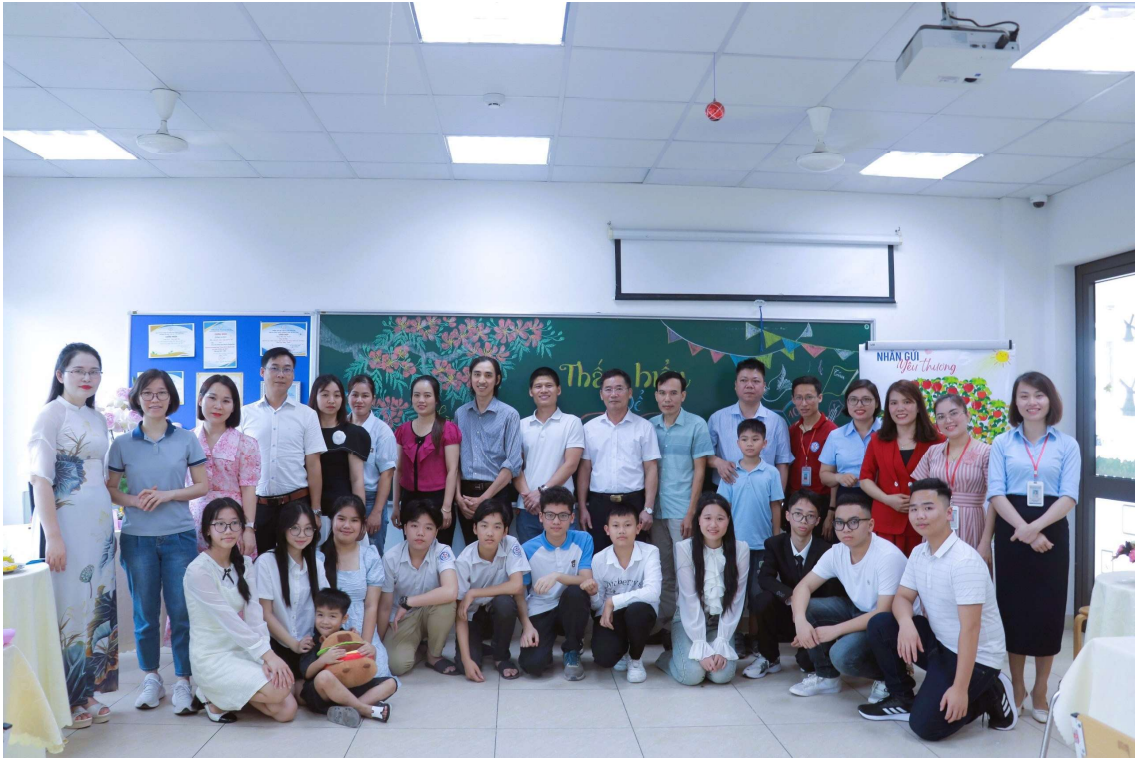
Tập thể lớp và GVCN lớp 9a1 trong chương trình.

Ba mẹ sẽ luôn dõi theo các con, thầy cô sẽ vẫn ở đây hi vọng, chờ đợi một ngày không xa, những cánh chim nhỏ dù bay đi muôn phương sẽ tìm về. Chúng ta hãy cùng nhìn lại những khoảnh khắc đáng yêu của chương trình.