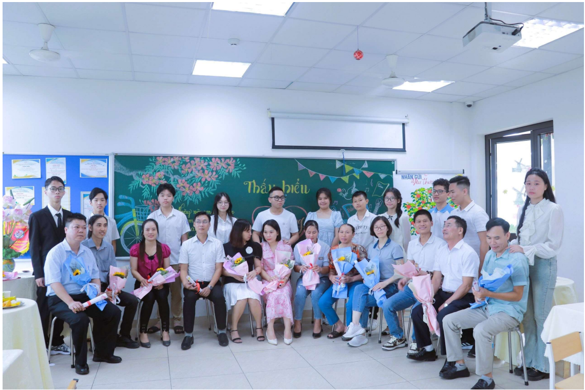
Các con học sinh tri ân, cảm ơn công lao ba mẹ.