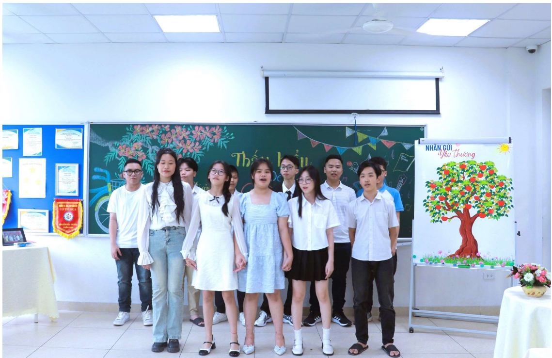
Các con hát tặng ba mẹ

Điều ấn tượng nhất trong chương trình có lẽ là khi các ba mẹ nhận được những lá thư tay với bao cảm xúc và lòng biết ơn ấp ủ của các con gửi tới ba mẹ, nhận được những bông hoa tươi thắm và những cái ôm ngọt ngào thay cho điều muốn nói.