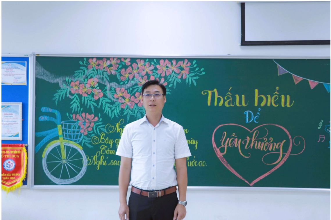
Đại diện phụ huynh phát biểu tri ân thầy cô.